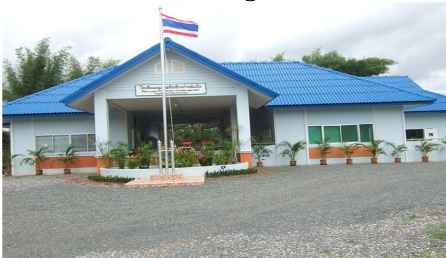
โรงเรียนอนุบาลคริสเตียนบ้านร่มเย็น อำเภอเชียงคำ จังหวัดพะเยา

สำหรับผู้ที่เชื่อและวางใจในพระเจ้า จะมีความชัดเจนว่าถึงแม้เราจะไม่รู้ว่าจะมีอะไรเกิดขึ้น แต่เรารู้และมั่นใจว่าใครคือผู้ที่จูงมือชีวิตเรา พระเจ้าจะเป็นผู้ชูใจและช่วยให้เราเผชิญทุกสิ่งได้และนำเราสู่หลักชัยอย่างมีศักดิ์ศรี. 😊