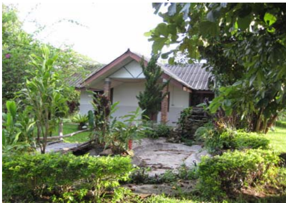
บ้านพักรับรองแขก