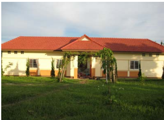
อาคารหอพักเด็กชาย