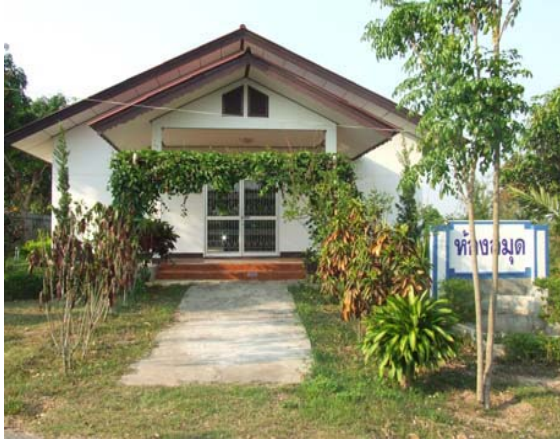
อาคารห้องสมุด