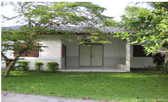
อาคารสำนักงาน และห้องพักรับรองแขก