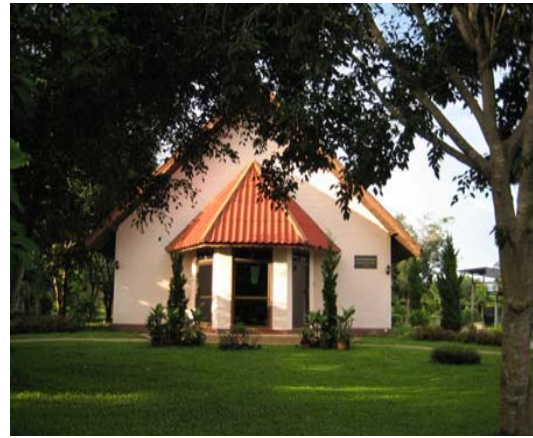
อาคารหอธรรม