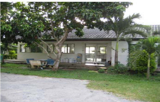
อาคารห้องเตรียมอาหาร