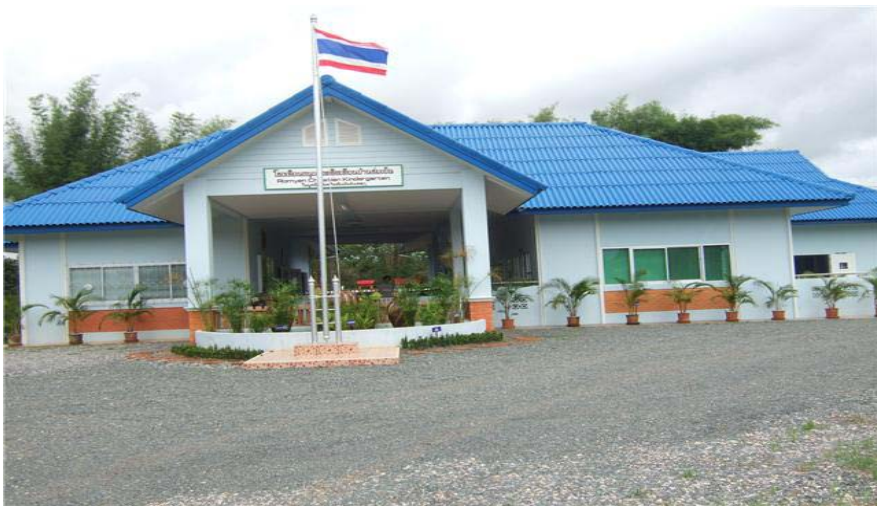
โรงเรียนคริสเตียนบ้านร่มเย็น อำเภอเชียงคำ จังหวัดพะเยา ในมูลนิธิพันธกิจสัมพันธ์เมตตา

.....ขอให้ผู้ที่อบอุ่นในอ้อมกอดแห่งความรักของพระเจ้า จงมอบอ้อมกอดนี้แก่คนอื่นด้วย.